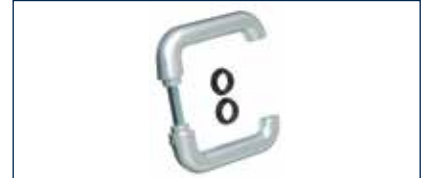
Die neue hochwertige Alu-Drückergarnitur passt optisch perfekt zum Multi-Tor