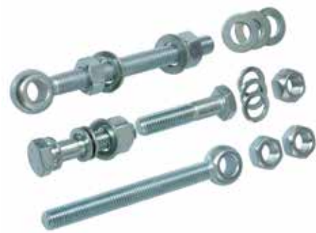
Sehr stabile Torbänder mit Augenschrauben versehen das Multi-Tor auf