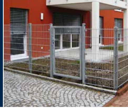
Profilschienenpfahl lt. GUVV