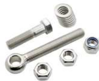
An den höhenverstellbaren Torbändern werden Augenschrauben verwendet

Änderungen vorbehalten. Maßangaben sind ca.-Angaben. 80-200501