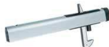
Der hochwertige Torflügelfeststeller wird bei 2-flügeligen RANKO Toren mitgeliefert