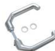
Die hochwertige Alu-Drückergarnitur passt optisch perfekt zu den RANKO Toren