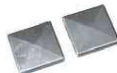
An den Torpfosten kommen dachförmige Alu-Kappen mit Überstand zum Einsatz