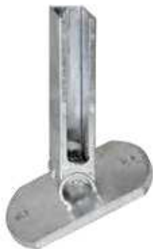
Perfekt zum RANKO Multipfahl : die Flexi-Bodenplatte von RANKO

Der Pfahl ist für Zaunhöhen von 600 mm bis 2430 mm verfügbar.