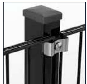
mit Klemmplatten mit langen Schenkeln