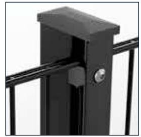
mit Flacheisen und Kappe mit Überstand

Änderungen vorbehalten. Maßangaben sind ca.-Angaben. 77-200501