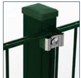
mit Klemmplatten mit kurzen Schenkeln