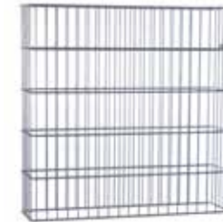
RANKO Gabione 26 Breite ca. 1010 mm, Tiefe ca. 262 mm