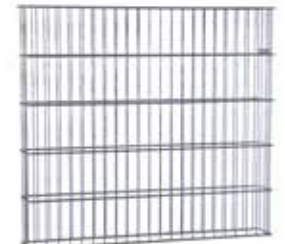
Gabione 16 Breite ca. 1100 mm, Tiefe ca. 165 mm