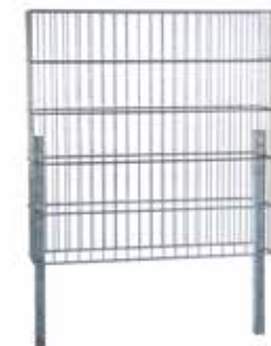
RANKO Gabione 26 bzw. 16 Breite ca. 1010 mm bzw. 1100 mm Tiefe ca. 262 mm bzw. 165 mm