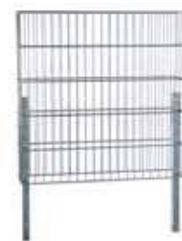
RANKO Gabione mit angeschweißten Pfählen