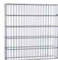
RANKO Gabione ohne angeschweißte Pfähle