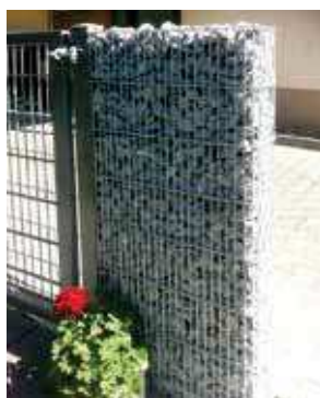
RANKO Gabione mit Maschenweite 25 x 200 mm

Gabione Typ 2m Breite: 2010 mm Tiefe: 165/262 mm