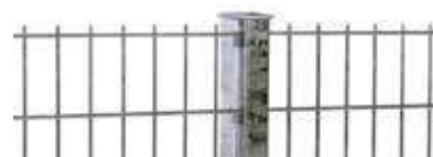
RANKO Profilschienenpfahl laut GUVV